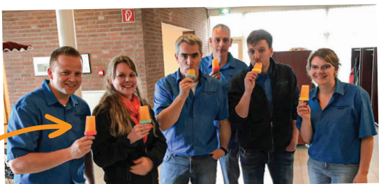
EEN DEEL VAN HET BESTUUR GENIET TIJDENS KONINGSDAG VAN EEN ORANJEBITTERAKET