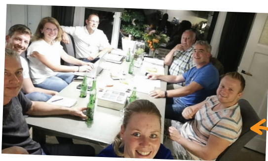
AL IN 2018 BEGONNEN WE MET SPARREN OVER DE FEESTWEEK.